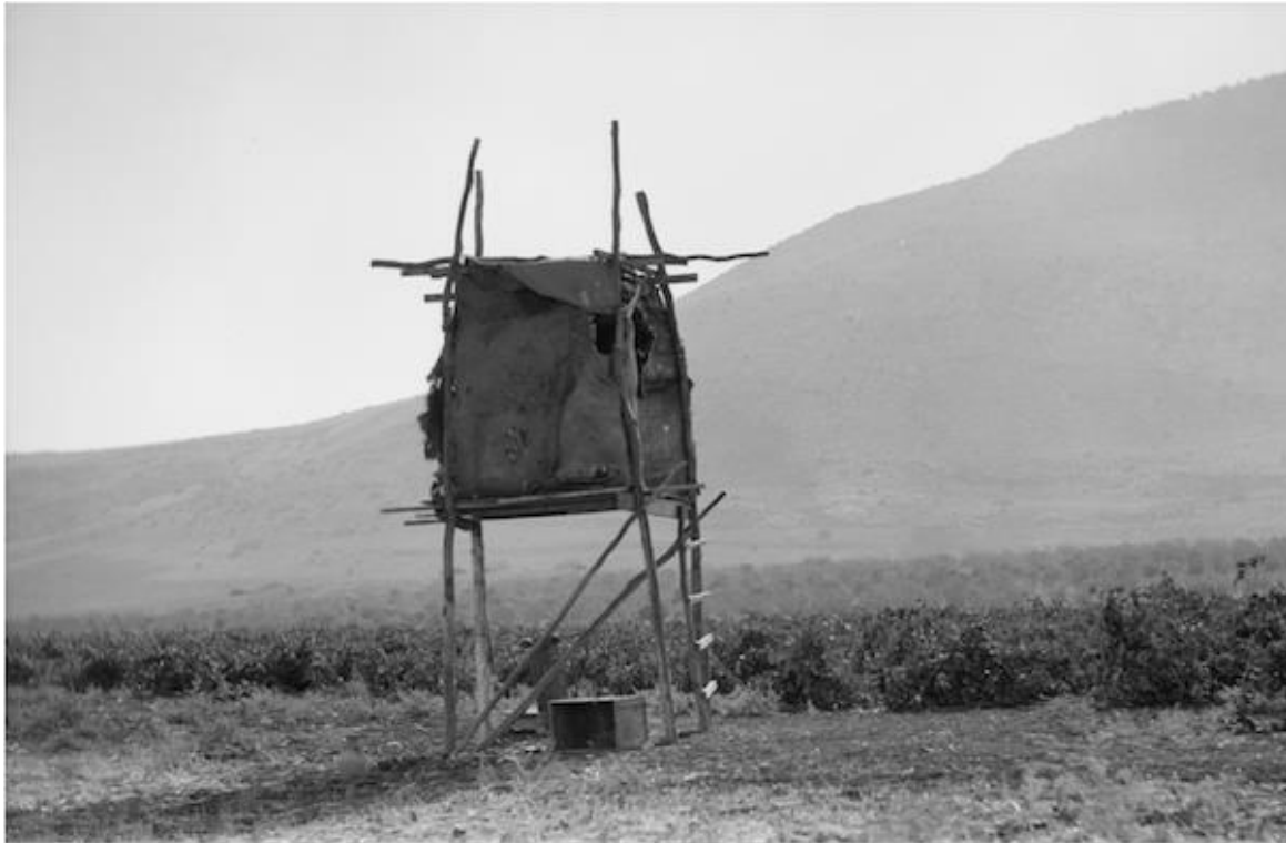
Een soeka in een wijngaard aan de voet van de berg Tabor, ca. 1920-1933

Alhoewel de boeken van Jesjaja en Jona ons veel vertellen over de soeka, weten we nog steeds niet waarom de soeka verbonden is met Soekot. Hiervoor wenden we ons tot een ander type bron, de volkenkundige beschrijvingen. Gedurende de 19e eeuw en de vroege 20e eeuw beschreven een aantal reizigers de gebruiken van de Arabische boeren in het land Israël, toen bekend als Palestina. Deze reisverslagen zijn belangrijk voor bijbelgeleerden omdat ze landbouwpraktijken beschrijven die erg lijken op die welke we vinden in de Tenach en archeologie. Bijvoorbeeld, in 1838 beschreven Edward Robinson en Eli Smith de druivenoogst buiten Hebron: